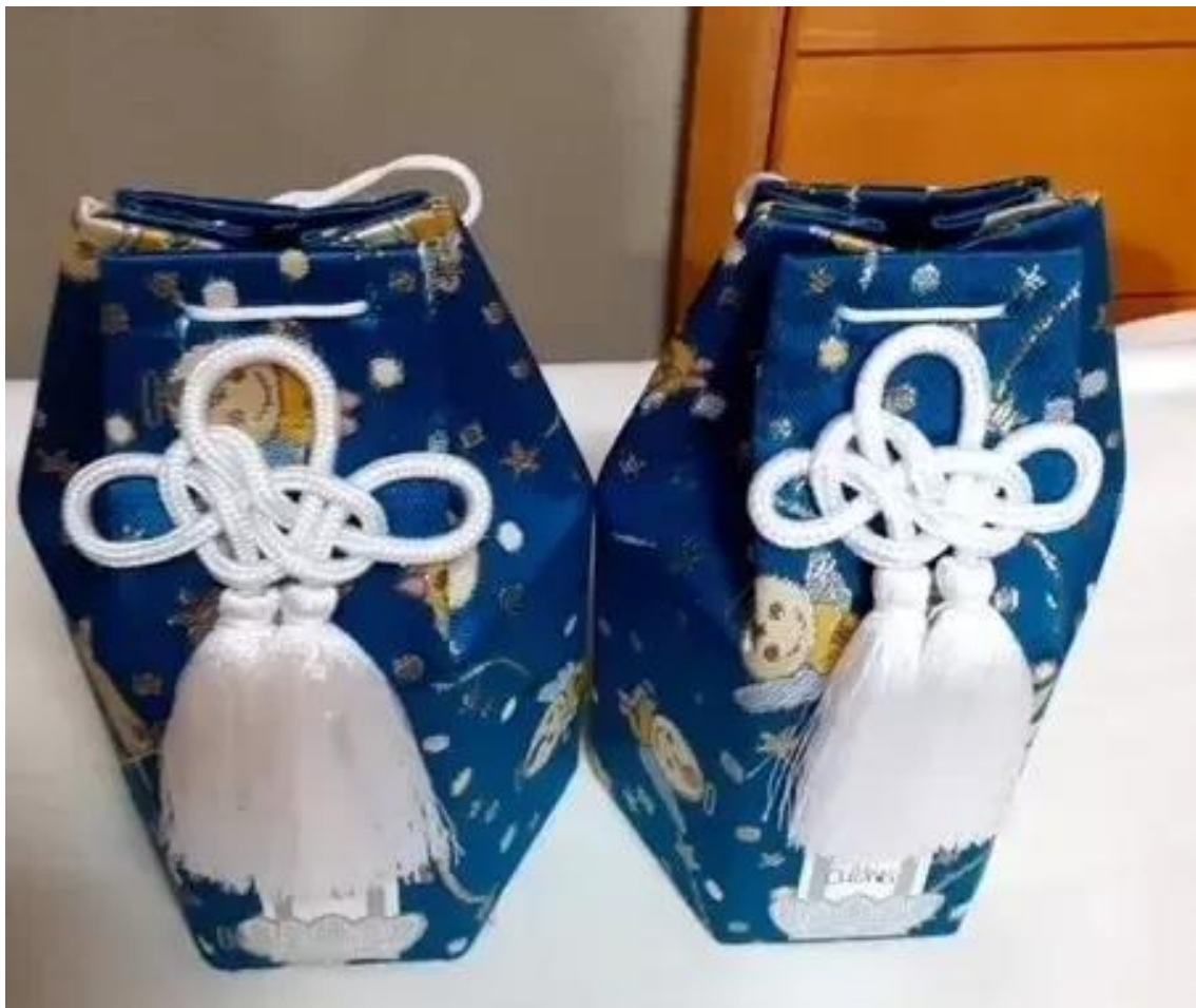
双子の遺骨の入った骨壺 コムスタカー外国人と共に生きる会

「わが子に強い悲しみや謝罪の気持ちを持ち、衷心をもって行われた行為は、強い嫌悪感や冒瀆感を喚起するものでもなく、目的・態様いずれも『遺棄』とは評価できない」として、無罪を主張した。